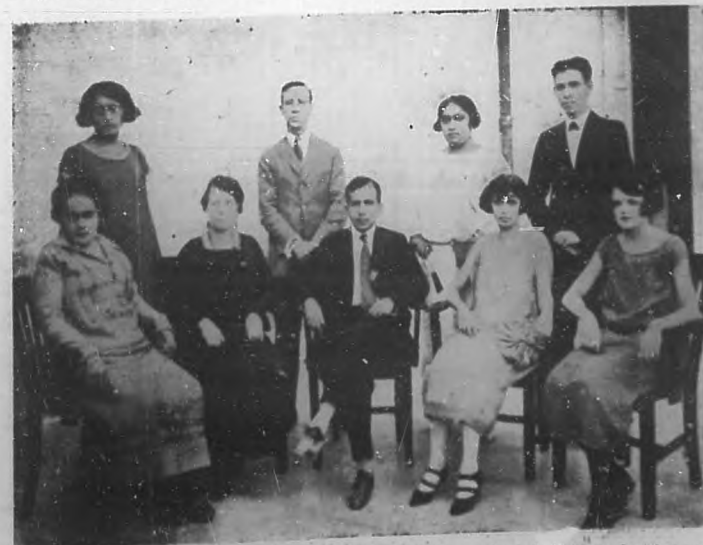
El director y cuerpo de profesores de la Escuela 75 del distrito escolar de la Habana. La labor que al frente de dicha escuela realizan su director y maestros merecen los más unánimes aplausos.