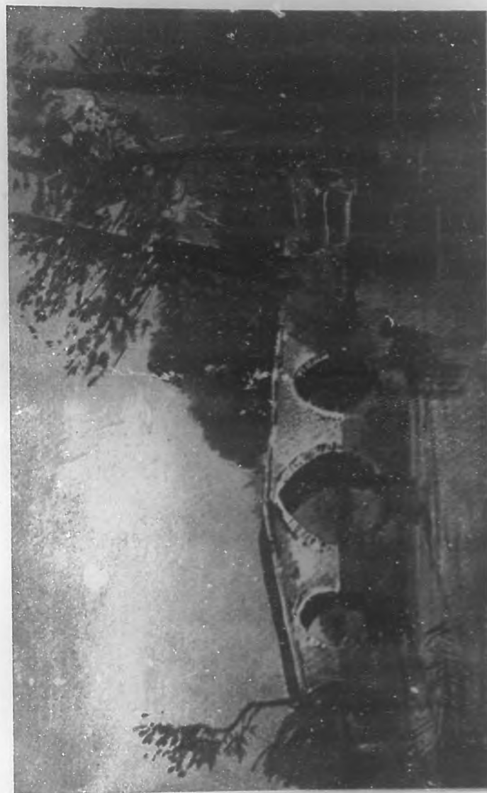
(Grabado taller de BOHEMIA.)