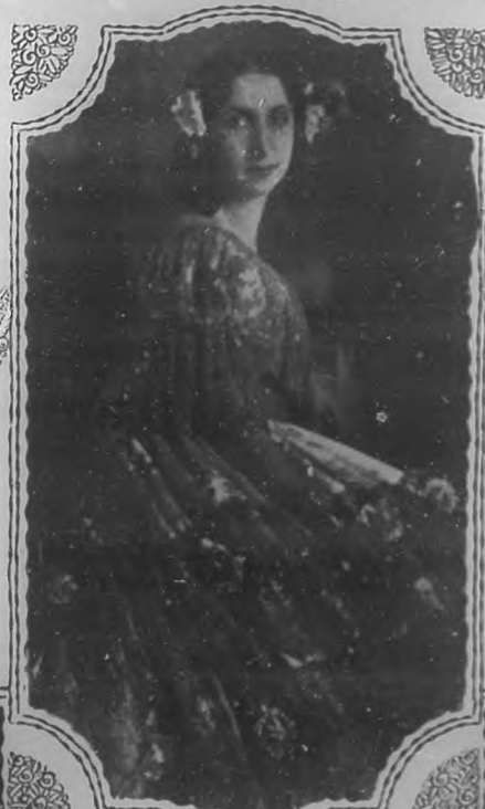
La célebre coloratura Amelita Galli-Curci, una de las cantantes que más admiradores cuenta en este país.