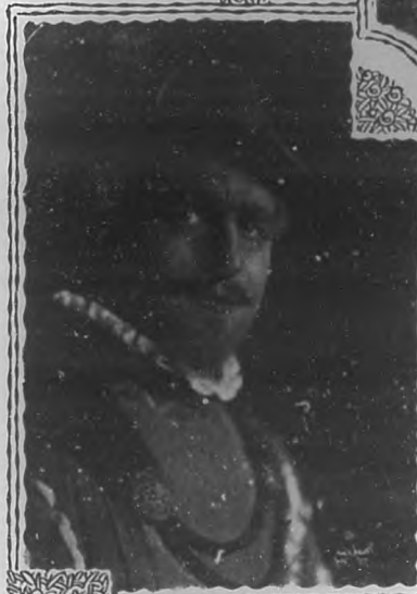
Martinelli, decano de los grandes tenores del "Metropolitan", que en forma interpretando el personaje postumo del malogrado Caruso.

Por primera vez en esta temporada se presentó ante el público new yorkino—hace ya algunas noches—la famosa coloratura italiana Amelita Galli-Curci. En el lapso que