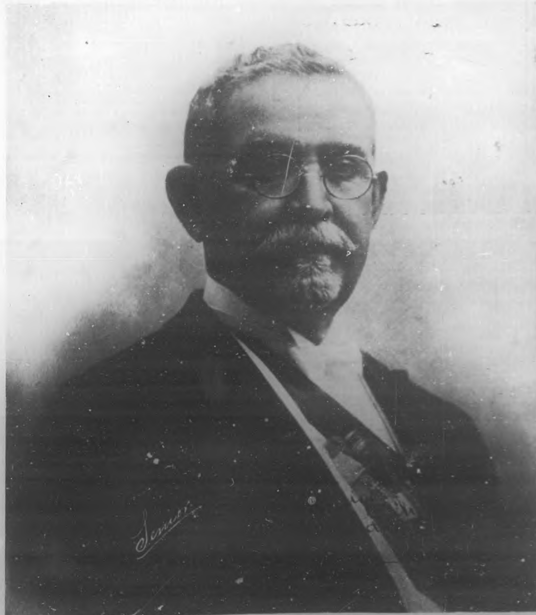
GENERAL HORACIO VAZQUEZ Ilustr. presidente de la República de Santo Domingo, la admirada nación hermana, a la que tan estrechos lazos de amistad y simpatía nos unen desde los tiempos gloriosos de nuestras luchas por la independencia.