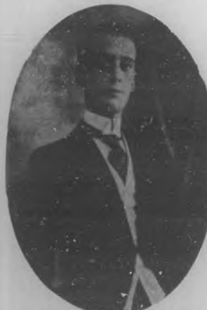
LCDO. RENE B. LLUBERES Culto y prestigioso caballero que desempeña el cargo de Consul General de la República Dominicana en esta ciudad, donde se ha conquistado hondo aprecio y vivas simpatías.

Sólida cultura, grandes prestigios, valiosas relaciones, es una figura el señor Zamora en cualesquiera de las actividades que se le es-