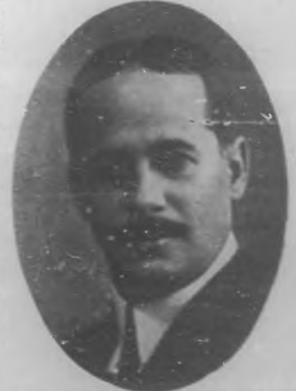
LCDO. PEDRO A. LLUBERES, HIJO Prominente hombre público dominicano, que actualmente ocupa el alto cargo de Secretario de Justicia e Instrucción Pública de la República Dominicana.