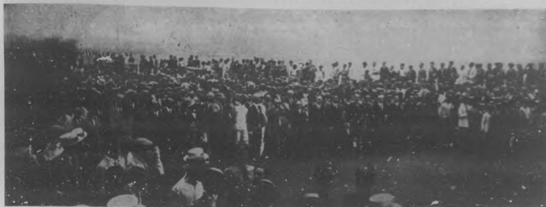
CELEBRANDO LA RATIFICACION DEL TRATADO HAY-QUESADA.—Un aspecto de la grandiosa manifestación efectuada el miércoles como demostración de gratitud al gobierno y pueblo norteamericanos por la ratificación del Tratado Hay-Quesada.