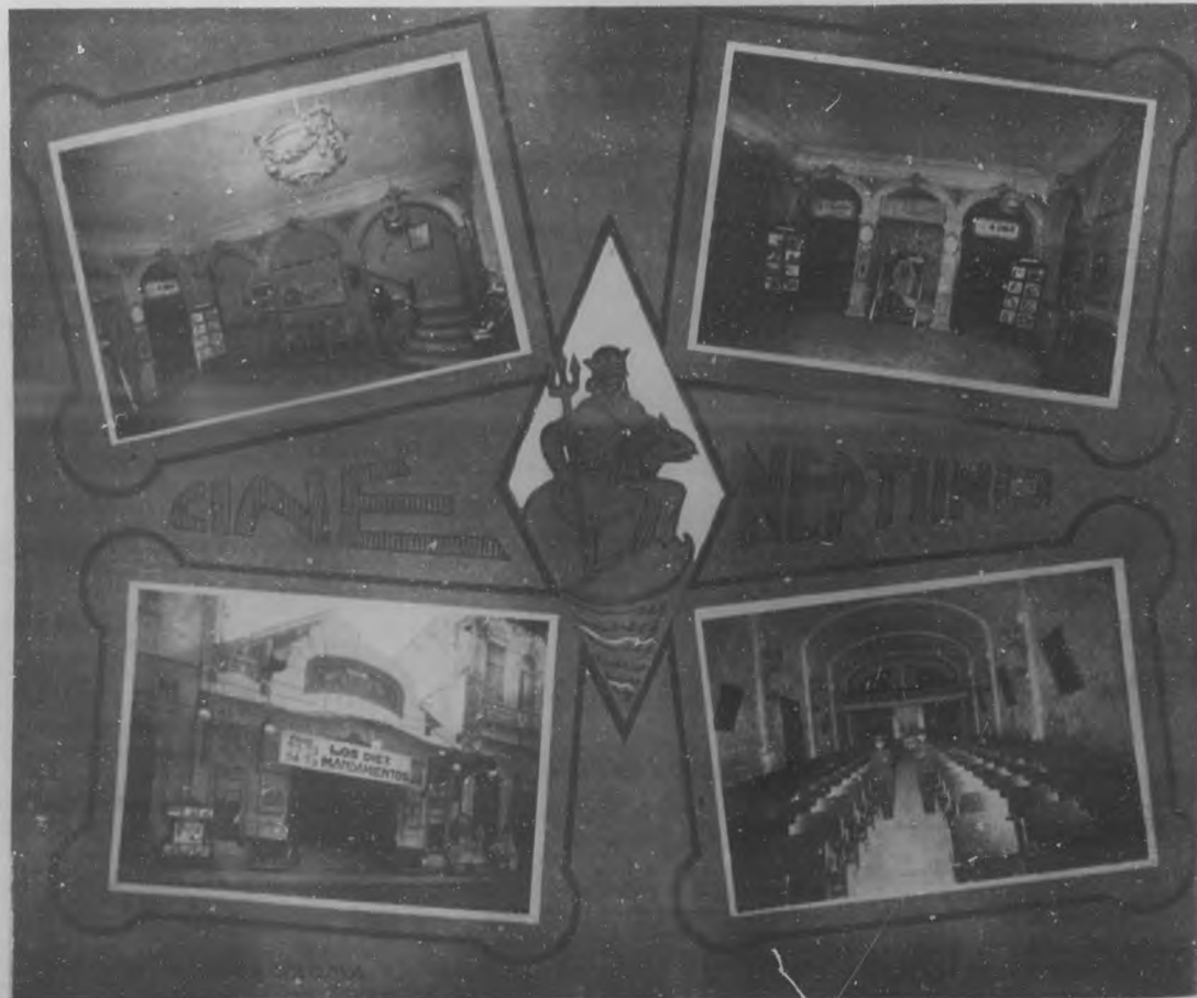
Varios aspectos del lujoso y favorecido cine "Neptuno", uno de los mejores de nuestra capital.