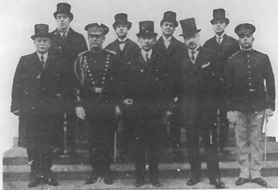
El Embajador de Cuba en Washington, y demás personal de la Embajada, saliendo de la Casa Blanca el día que presentó sus credenciales al Presidente de los Estados Unidos de América.

Eugenio Montero Ríos, el metafísico autor de "Las Demas", etc., para legarnos un pleito, no contó, cuando elaboro su cocido diplomático, que para desmenuar esa intriga bastaban dos cosas: la buena fe de la mayoría del pueblo americano y la arrogancia de Cuba, siempre en la trinchera del sacrificio por su libertad, por su independencia, por su soberanía y la intangibilidad de sus sagrados derechos. Lo lamentable es que aquel estadista insigne no contemple la obra del presente: la victoria del del Embajador cubano, en Washington, que borró, con sus alien-