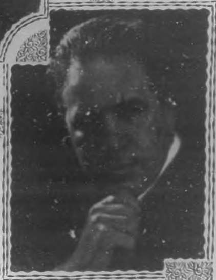
su papel. Cantó bien y demostró ser el mismo gran actor de sus días mozos.

Este año se presentó Titta-Ruffo por primera vez, en compañía de la Galli-Curci. El célebre baritono está mucho mejor de voz que en años anteriores y en todas las obras que ha cantado logró mantener el prestigio artístico de que goza. Claro que la música de Figaro requiere una voz más flexible que la de Titta-Ruffo, pero el feliz intérprete de Hamlet salió airoso y triunfante de