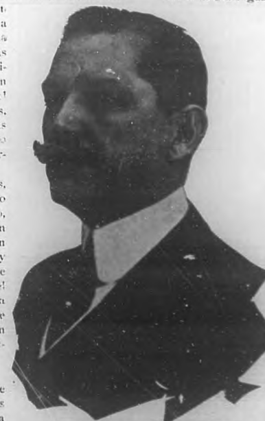
DR. COSME DE LA TORRIENTE Embajador de la República de Cuba ante el gobierno de los Estados Unidos de América.

El párrafo de oro del discurso del Embajador Torriente que más