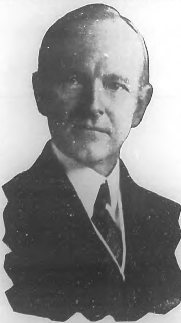
Ultimo retrato de Mr. Calvin Coolidge, Presidente de los Estados Unidos de América.