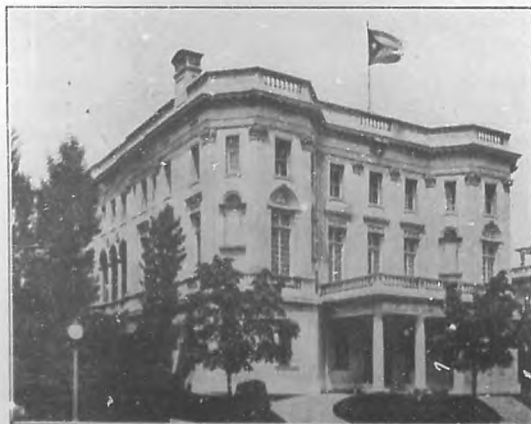
Residencia de la Embajada cubana, en Washington. Edificio propiedad de la República de Cuba.

tos, lo que nunca debió haberse consignado en tan malévolos términos, la causa de esta controversia que ha durado veinte y seis años en resolverse.